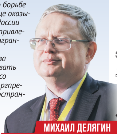
МИХАИЛ ДЕЛЯГИН

«Крокус» стал синонимом чудовищной трагедии, и мы с однопартийцами считаем, что к террористам, его совершившим, должна быть применена смертная казнь! — уверен депутат Государственной Думы РФ от Партии СПРАВЕДЛИВАЯ РОССИЯ , заместитель Председателя Комитета ГД РФ по экономической политике Михаил Делягин . — Кроме того, в правоохранительных органах необходимо воссоздать структуры по борьбе с этнической мафией, которая все чаще оказывается оружием в руках враждебных России государств. Мы также выступаем за привлечение работодателей нелегальных мигрантов и организаторов их транзита к ответственности по статье УК РФ за работу торговлю. Призываем рассматривать нежелание мигрантов сотрудничать со следствием как признак соучастия в оргпреступности, а въезд ранее судимых иностранцев должен быть и вовсе запрещен! А главное — нам нужен естественный прирост коренного населения, а не его замещение!»