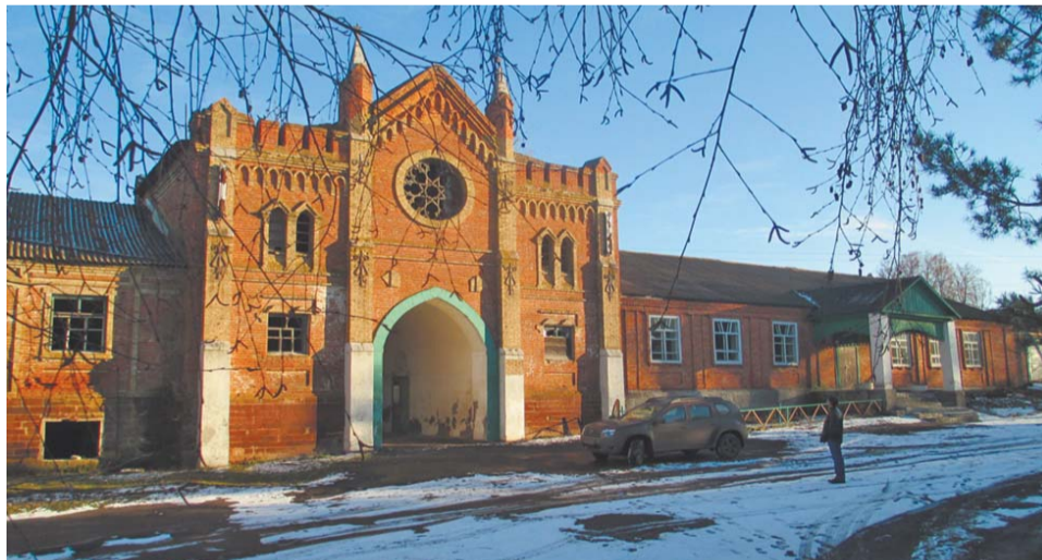
Северная башня Охотникова замка