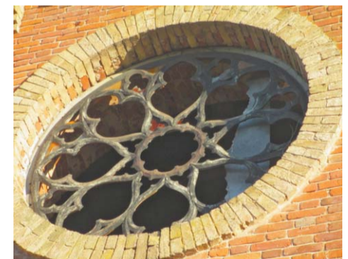
Роза в круглом окне

История семьи Охотниковых богата интересными фактами. Начинается она с елизаветинских времён и повествует о гвардейце и предводителе дворянства, о декабристе и художнике, рисовавшем Лермонтова и его друзей, о драгуне и его друзьях знаменитых гусарах, среди которых был и великий поэт, о сенаторе и кавалере в ранге статского генерала, о придворном шталмейстере и любителе лошадей, конезаводчике. Есть на что посмотреть, о чём услышать и поразмыслить. Чем не «изюминка»?