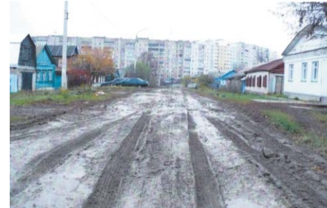
После грейдирования жидкой грязи

покрытием - слишком дорого, да и проектно-сметной документации нет, впрочем, её и не планируется делать в 2012 году. Но, утешил чиновник, грейдирование переулка включает в муниципальное задание для «Спецавтобазы».