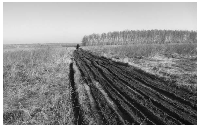
Когда появятся на этой земле дома многодетных семей, зависит от сроков создания инфраструктуры