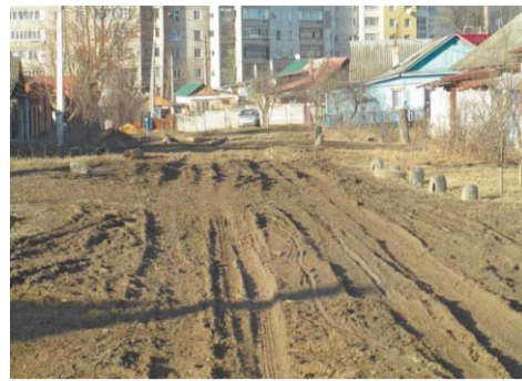
Когда везде уже сухо, здесь так