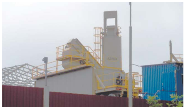
Новое вредное производство в уже и так экологически неблагоприятном районе