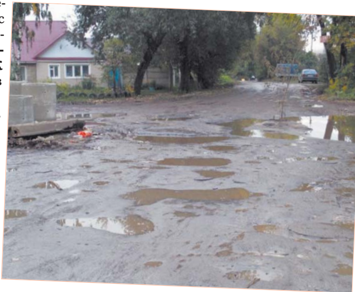
Скульптурная ждёт миллионов

я и свернул на Гагарина, подъезжаю к Городской. Вот так сюрприз! «Кирпич!» Думаю, сотрудники ГИБДД могут аргументированно в протоколе разъяснить, что движение на участке дороги, с обеих сторон которого размещён этот запрещающий знак, не может считаться открытым, даже если асфальтовое покрытие в прекрасном состоянии. А времени-то на объезд у