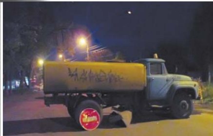
Вечером 17 сентября водовозка на страже порядка