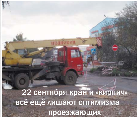
22 сентября кран и «кирпич» всё ещё лишают оптимизма проезжающих