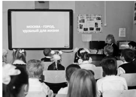
Урок «Москва – город удобный для жизни», который прошел в Молжаниновской школе за несколько дней до ее закрытия.

Старшеклассников собрали в здании управы района к 12:30 и повели на платформу Планерная, где, по словам директора школы, их ждут автобусы, которые доставят учеников до школы №19. Однако автобусов не было. Директор школы сказала старшеклассникам, что покажет им дорогу до школы пешком. Зачем, если будут возить на автобусах? Дорога была мокрая и грязная. На Новосходненском шоссе пешеходный переход был еле виден под глубокими лужами, родители и учителя пе-