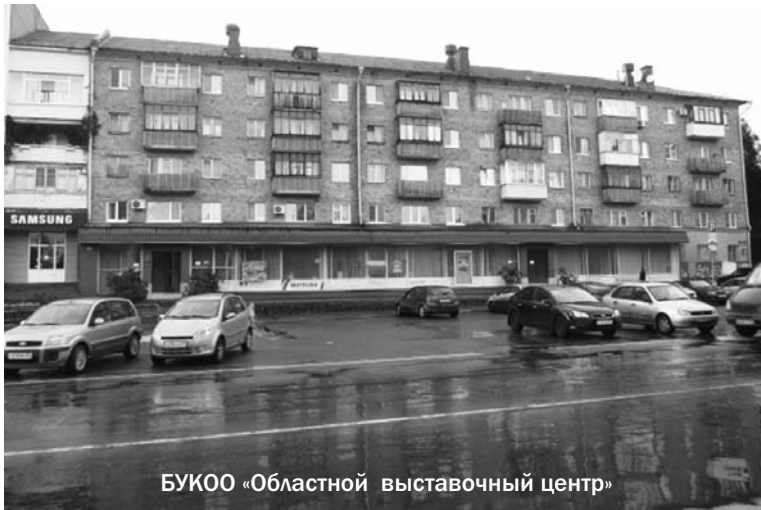
БУКОО «Областной выставочный центр»

Так, к примеру, помещение областного выставочного центра занимает весь первый этаж многоквартирного жилого дома по улице Салтыкова-Щедрина, 33, имеет обособленные входы. Подъезды жильцов находятся на противоположной стороне здания, подвалы выставочного центра и жильцов разделены глухой стеной и тоже имеют отдельные входы. Таким образом, ни сотрудники, ни посетители выставочного центра ни при каких условиях не пользуются ни освещением подъездов и подвалов жильцов, ни даже фонарями во дворе. Энергоснабжение центра в соответствии с актом об осуществлении технологического присоединения от 26 февраля 2008 года осуществляется по отдельной линии, независимо от остальных потребителей многоквартирного дома. Значит, он не получает энергию через общедомовой счётчик, находящийся в части подвала, относящейся к