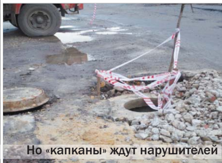
Но «капканы» ждут нарушителей

Сложно устроен человеческий мозг. Нейроны там всякие, импульсы... Не всегда и поймёшь, почему вдруг давно забытые впечатления всплывают, какие ассоциации их пробуждают.