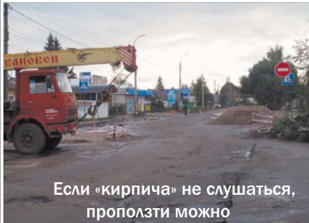
Если «кирпича» не слушаться, проползти можно