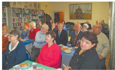
Юбиляры внимательно смотрят на сурдопереводчика, так они «слушают» обращение гостей

К сожалению, сегодня для неслышащих инвалидов орловщины не созданы комфортные условия для интеграции в общество. Утрачено и то, что было достигнуто в СССР. Даже такие элементарные вещи, как бегущая строка или субтитры в передачах орловского телевидения отсутствуют! Неслышащие