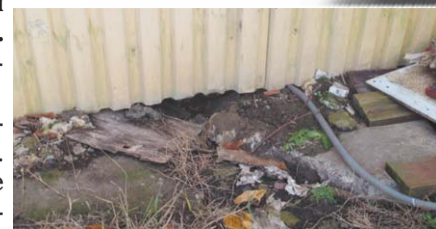
А кошкам счастье

На сходе граждан 26 ноября 2013 года представители администрации посёлка предложили нанимателям своими силами и на свои средства ремонтировать общее имущество в нарушение Жилищного Кодекса РФ. Наниматели платить отказались. Вспомнили жители и ООО «Управляющая компания», которая, выиграв конкурс на управление, собирала с граждан плату за содержание жилья, не выполняя никаких работ. В ответ на это представители администрации рекомендовали нанимателям подать в суд на УК.