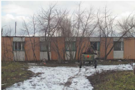
... и не служит так долго, как временное