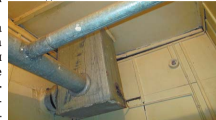
Стены направились в землю