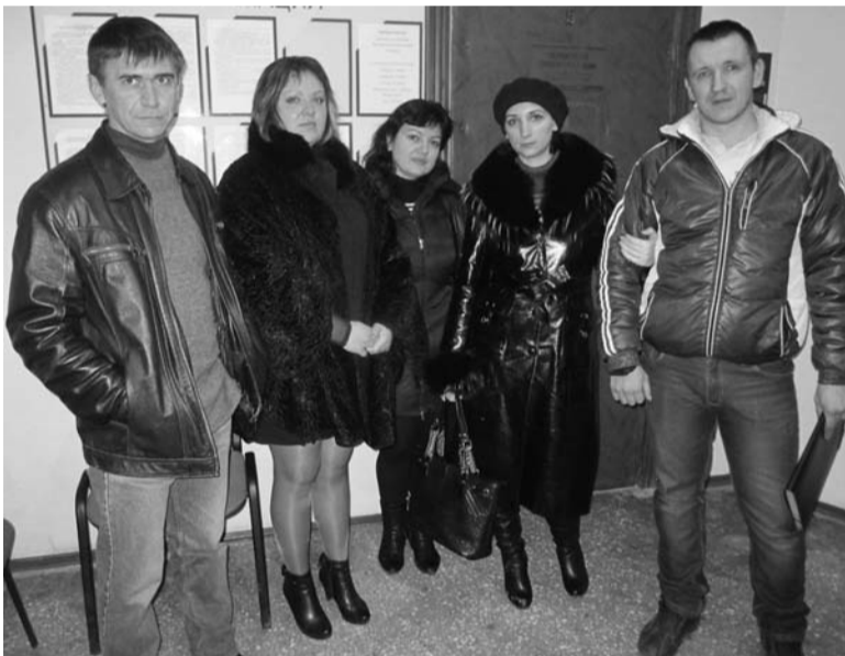
Многодетные семьи намерены добиваться реализации права на пригодные для индивидуального жилищного строительства участки с необходимой коммунальной инфраструктурой в суде

Насчёт коммуникаций опять всё гладко, логика истинно бюрократическая: «...жилище образования №4 и №5 по улице Калининкова и улице Дуговой для индивидуального строительства, изначально проектировались в пределах существующего населённого пункта, а это значит, инженерные сети находятся от предоставленных участков на доступном для подключения расстоянии».