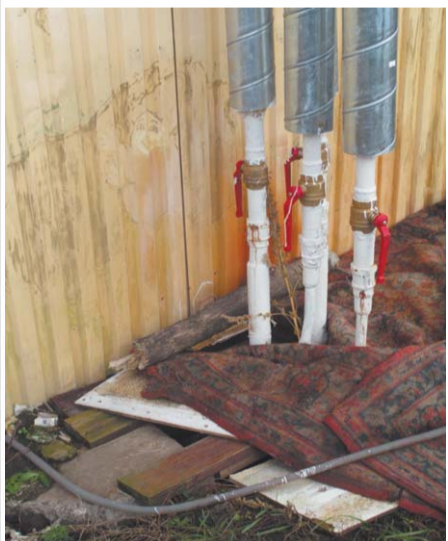
Каков уровень энергоэффективности?!

«Финский посёлок», как называют его жители посёлка Долгое, появился в восьмидесятых годах во время строительства газораспределительной станции. Весёленькие, тёплые каркасно-щитовые домики - временки строителей - были построены по финской технологии. Для временных строений они были даже очень хороши. Когда строительство закончилось, домики стали общежитиями для рабочих газораспределительной станции, затем перешли в собственность района, а пару лет назад стали собственностью посёлка Долгое.