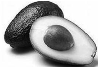
Вкус авокадо хорошо сочетается со вкусом креветок

В подсоленной воде отвариваем 300 граммов креветок или морского коктейля. В это время мелко режем 1-2 мягких авокадо, давим или мелко трём 1-2 зубчика чеснока, добавляем 1 столовую ложку лимонного сока и перемешиваем. Добавляем 4 порезанных кубиками помидора и остуженные морепродукты, немного маслин, рвём пучок листьев салата. Для