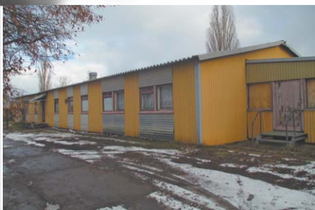
Ничто не обходится так дешево...