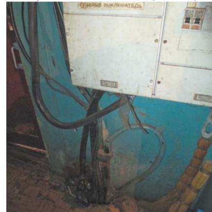
Перебои с электричеством здесь не редкость

Под стеной в ванной дырка на улицу, Крыша многие годы течёт, «Уж не рухнет ли?» - люди волнуются. Беспоощадно как время идёт. И сюрпризы жильцам не в диковину: Ходят в гости собаки, коты, И зимою, все льдами окованы, Не дают в ванной трубы воды. Намечает снежок в коридорчике - Дверь входная рассыпалась в хлам. Ни УК, ни посёлок не чешутся. Их ответ - помоги себе сам! Перспективы развалин значительны, Отработан чиновничий хлеб - Может выйти здесь вскоре для жителей Комфортабельный жёлтенький склеп.