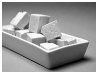
Тофу полезен и питателен

Из этого салата исключаем мясо, колбасу и яйца. Им на замену опытные новогодние постящиеся используют или тофу (соевый творог), или отварного кальмара, или креветки. Остальные ингредиенты традиционные. Майонез постный.