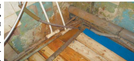
Залатав большую дыру в полу ванной, доски повесили на стены