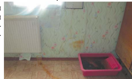
Плачут в доме и потолки, и радиаторы