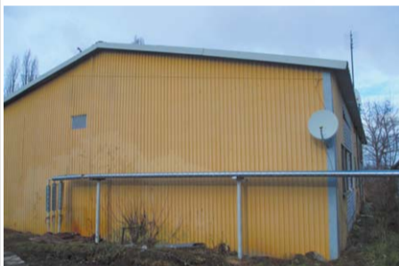
Дом на Газопроводской, 13 на старости лет стал жилым