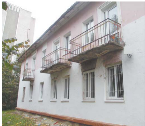
Таковыми же «красивыми», как оставшиеся балконы, были и оконные рамы