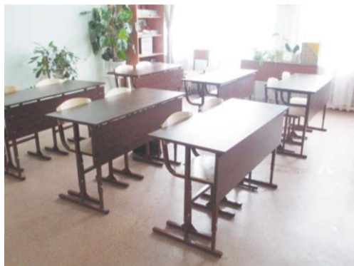
За новыми партами ребятам приятно сидеть на уроке