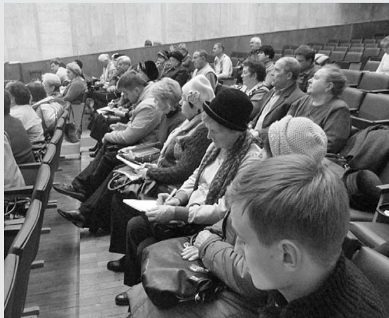
Жилищные активисты Орла напрасно ждали областного чиновника

сали об этом в №2 (№23) от 15 августа 2013 года. Информацию можно получить у нас в офисе.)