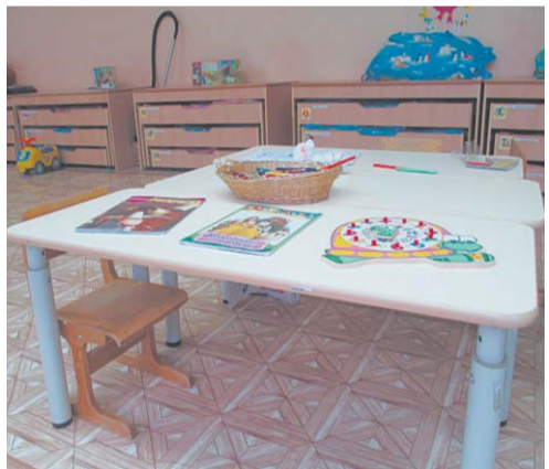
За новыми столиками удобно рисовать и мастерить поделки