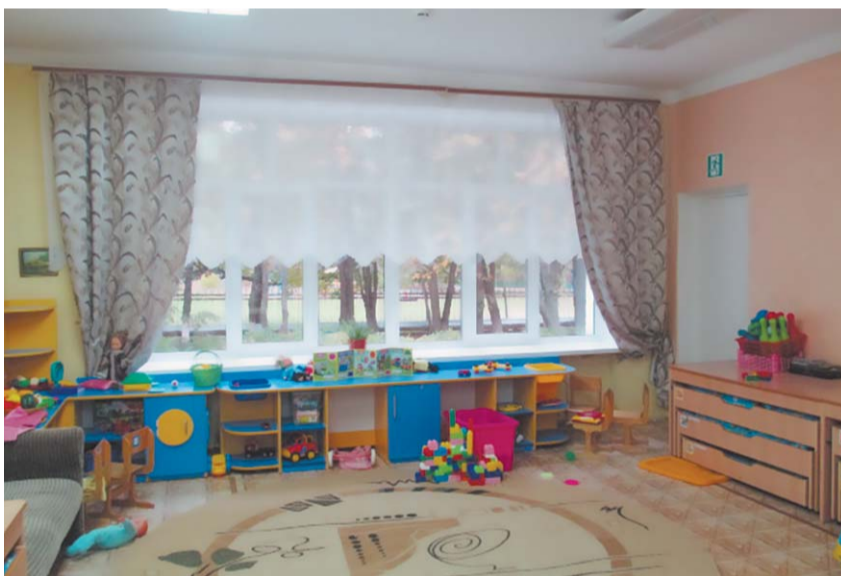
Теперь малышам из группы «Солнышко» тепло, и смотреть в окошко приятно