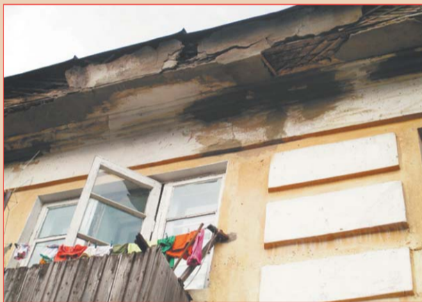
Без каски не ходить!