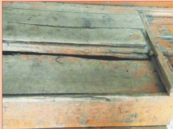
Полы не топтать!