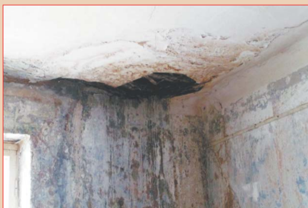
В потолок не плевать!

включения в областную программу. А они уж, наверное, думали, что их всех скоро расселят. Причём критерии этого конкурентного отбора никак не конкретизированы.