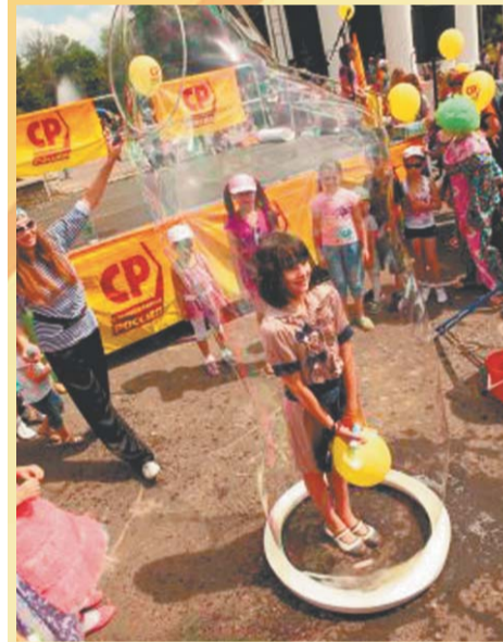
Празднование Дня защиты детей, организованное справедливороссами, понравилось орловчанам! Дети не скучали!