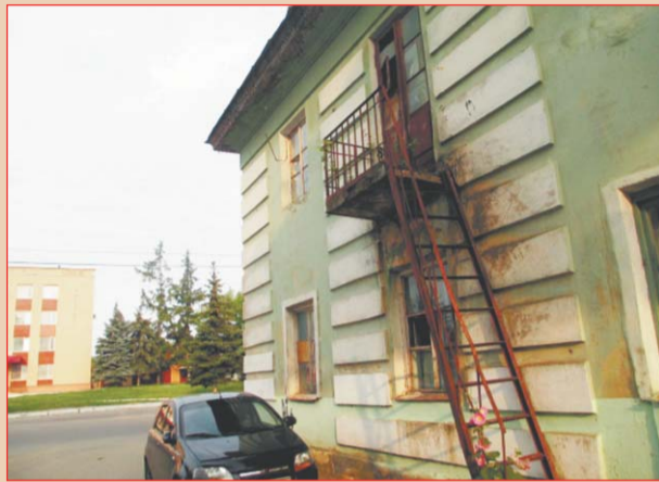
Дом по адресу пер. Трамвайный, 2. Прямо напротив - здание администрации Железнодорожного района г. Орла.

Этот дом по Трамвайному переулку, 2 не признан аварийным «в установленном порядке». Простых людей легко гонять по кругу и отвечать на их обращения умными фразами. 63% квартир в развалюхе муниципальные, но от властей инициативы последовать «установленному порядку» не поступало.