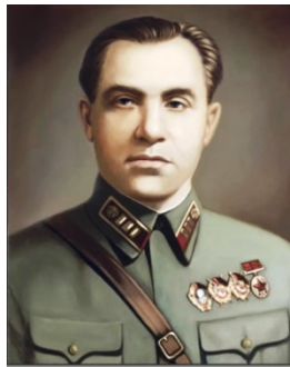
ПОЛКОВНИКА СТАРИНОВА ул.

Похоронен на Новодевичьем кладбище в Москве.