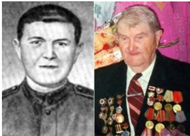
ВОРОНОВА ул. и сквер