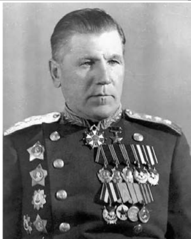
ГЕНЕРАЛА ГОРБАТОВА пл. и ул.