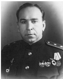
ГЕНЕРАЛА РОДИНА ул.

Похоронен в Москве на Новодевичьем кладбище.