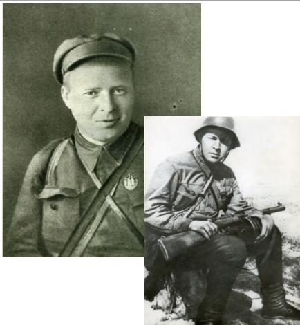
ГАЙДАРА ул. и пер.

ГАЙДАР Аркадий Петрович (Голиков) (1904 – 1941). Детский писатель, участник Гражданской и Великой Отечественной войн. Родился в городе Львов Курской губернии. Во время Великой Отечественной войны Гайдар находился в действующей армии в качестве корреспондента «Комсомольской правды». Написал военные очерки «У переправы», «Мост», «У переднего края», «Ракеты и гранаты». После окружения в сентябре 1941 частей Юго-Западного фронта в районе Умань - Киев Аркадий Гайдар попал в партизанский отряд Горелова, где был пулемётчиком. Пять партизан во главе с Аркадием Гайдаром двигались по направлению к новой базе партизанского отряда (несли продукты для бойцов). Утром 26 октября 1941 года они остановились на привал рядом с железнодорожной насыпью в районе села Лепляво у железной дороги Канев-Золотоноша. Гайдар взял ведро, чтобы набрать картошки в доме путевого обходчика. На самом гребне насыпи заметил притаившихся в засаде немцев. Успел крикнуть: «Ребята, немцы!», - после чего был убит пулемётной очередью. Это спасло остальных - они успели уйти от засады. По свидетельствам местных жителей, Гайдар был убит на рассвете, но засада была организована немцами ещё вечером. В состав засады входил мотоцикл с коляской и пулемёт. То, что убитым был именно Аркадий Гайдар, выяснилось только после войны. В 1947 году останки Гайдара были перезахоронены в городе Каневе.