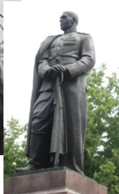
ГУРТЬЕВА ул. и сквер.

ГУРТЬЕВ Леонтий Николаевич (1891 – 1943). Генерал-майор, командир 308-й гвардейской стрелковой дивизии 3-й армии. Герой Советского Союза. Родился в городе Шемаха Шемахинского уезда Бакинской губернии. Весной 1942 года полковник Леонтий Гуртьев на базе возглавляемого им Омского военно-пехотного училища имени М.В. Фрунзе сформировал 308-ю стрелковую дивизию, части которой участвовали в Сталинградской битве. За месяц боёв воины дивизии под его командованием уничтожили 20 000 гитлеровских солдат и офицеров, 143 танка, около 100 артиллерийских и миномётных батарей, 37 противотанковых орудий, несколько самолётов, 41 тяжёлый пулемёт, 53 автомашины с войсками и грузами. Дивизия была награждена орденом Красного Знамени, а её командиру полковнику Леонтию Гуртьеву было присвоено воинское звание «генерал-майор». В феврале 1943 года его дивизия была перебросена на Калининский фронт, участвовала в Ржевско-Вяземской операции. На Курской дуге 12 июля – 3 августа 1943 года дивизия под его командованием прорвала сильно укреплённую оборону врага в районе села Измайлово (ныне Новосильского района), внеся значительный вклад в разгром орловской группировки противника. За боевые заслуги дивизия была преобразована в 120-ю гвардейскую стрелковую дивизию. Генерал-майор Гуртьев погиб в бою 3 августа 1943 года в районе деревни Калиновка (ныне Орловского района). Его похоронили в сквере «Братские могилы». После войны останки генерала были перезахоронены на воинском участке Троицкого кладбища.