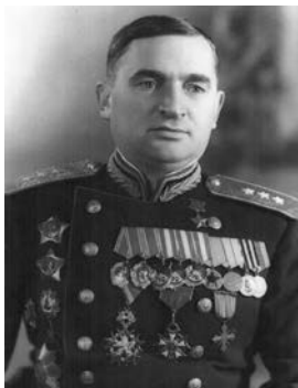
ГЕНЕРАЛА ЖАДОВА ул.