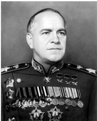
МАРШАЛА ЖУКОВА пл.

ЖУКОВ Георгий Константинович (1896 – 1974). Маршал Советского Союза (с 1943). Четырежды Герой Советского Союза, кавалер двух орденов «Победа», множества советских и иностранных орденов и медалей.